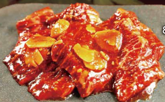
サガリ ガーリック 醤油

8,800 yen per person (tax included) / 一个人是8800日元。(含税)