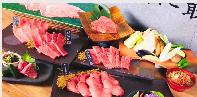
プラチナ宴会コース ¥8,000