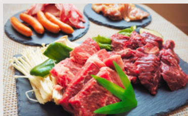
コスパ宴会コース ¥5,000