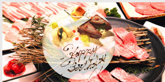
誕生日宴会コース ¥5,000